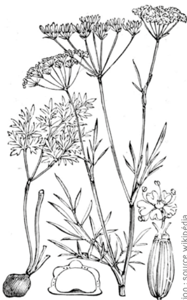
443. Conopodium denudatum Koch.