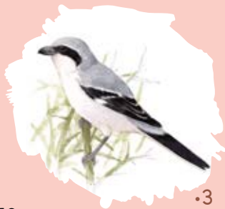
Pie Grièche grise Lanius excubitor