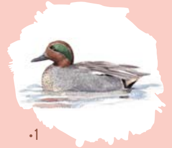
Sarcelle d'hiver Anas crecca