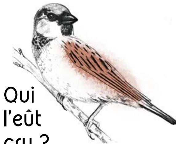
Illus : Julie Bornes

Contact : Manon Campenet - chargée de mission TEPOS 06 31 85 86 68 - tepos@pnr-millevaches.fr