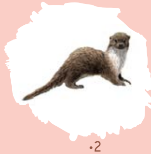
Loutre d'Europe Lutra lutra