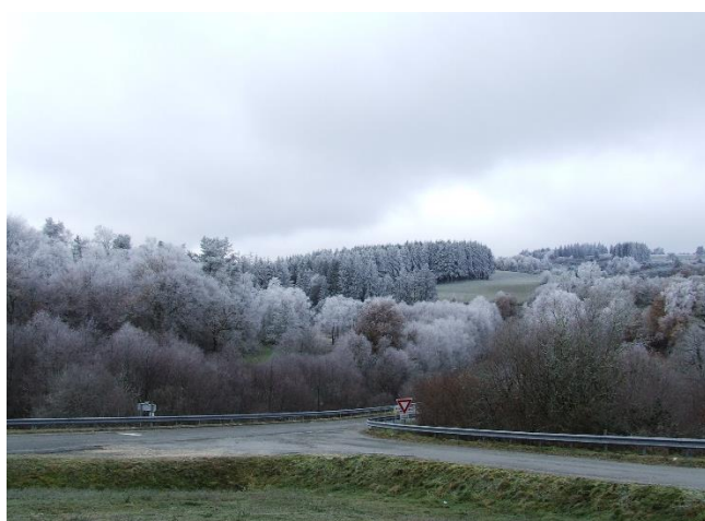
Entrée de bourg nord-ouest

Le périmètre d'intervention de l'étude peut être ajusté en fonction des enjeux identifiés et du coût de la prestation.