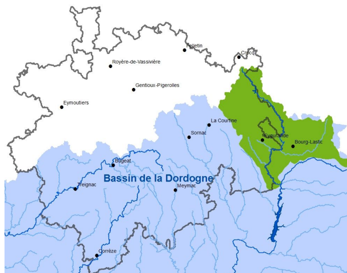
Figure 1. Localisation du bassin versant du Chavanon

Ce territoire de têtes de bassin versant se caractérise par un réseau hydrographique dense et par une forte présence de zones humides. La connectivité importante des activités aux milieux aquatiques explique la vulnérabilité et la dégradation croissante de cette ressource. Cela se manifeste en premier lieu par la dégradation morphologique des cours d'eau (problèmes de colmatage et d'ensablement généralisés) et la banalisation des zones humides. De plus, on constate une évolution négative de la qualité de l'eau et une perte de la singularité écologique des têtes de bassin notamment par la régression d'espèces autochtones.