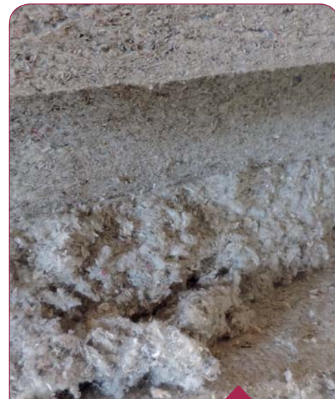
La ouate à l'état de matériau brute