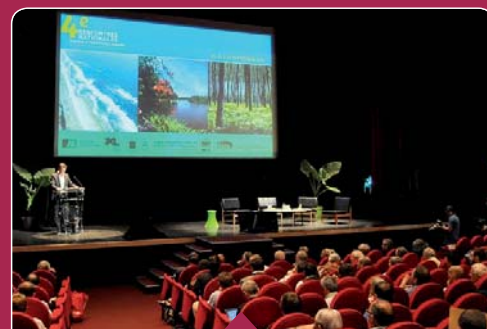
Journées Territoires à Energie Positive

citoyennes. Un évènement à part entière avec des débats et retours d'expériences sur le territoire national ou européen, des ateliers et des visites. Une délégation Millevaches s'y est rendue avec des élus et techniciens du PNR ainsi que des personnes d'associations locales (DFER et EPD). Ainsi, des bonnes initiatives ont été découvertes et des contacts pertinents pour des prochains projets de territoires ont été constitués.