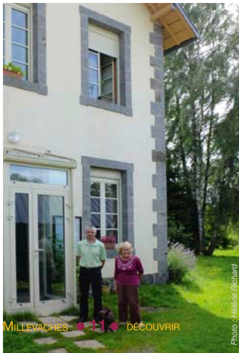
MILLEVACHES • 11 • DÉCOUVRIR