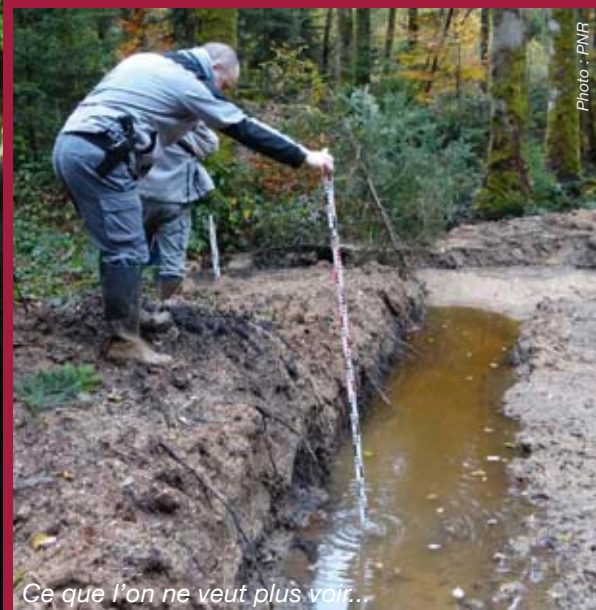
Ce que l'on ne veut plus voir...