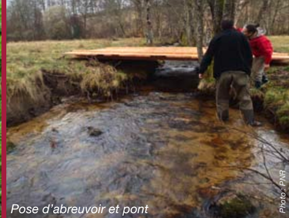
Pose d'abreuvoir et pont