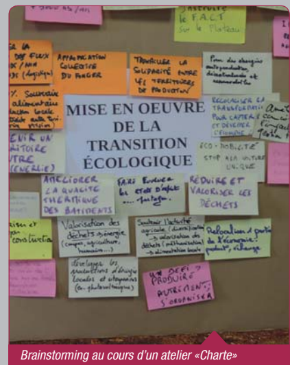
Brainstorming au cours d'un atelier «Charte»